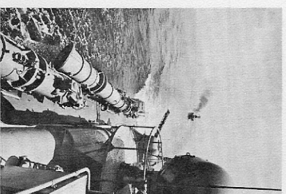
Titelbild Sowjetische Torpedoschnellboote der „Sherstun“-Klasse bei Luftabwehrübungen.